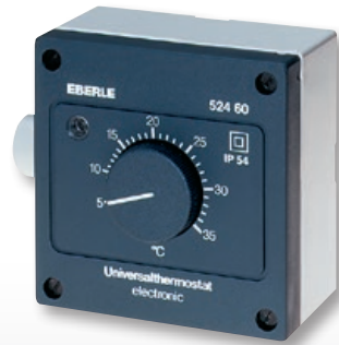
AZT-A 524 510/AZT-A 524 410