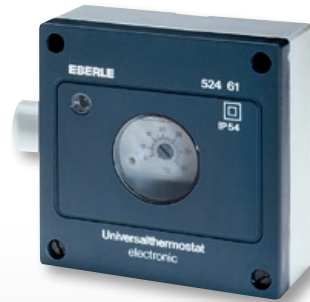
AZT-I 524 510/AZT-I 524 410