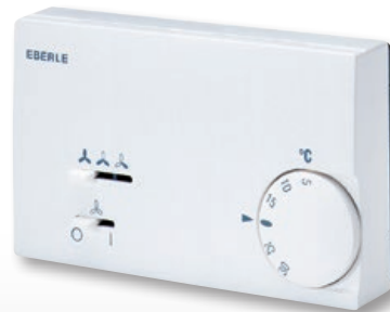
KLR-E 525 56