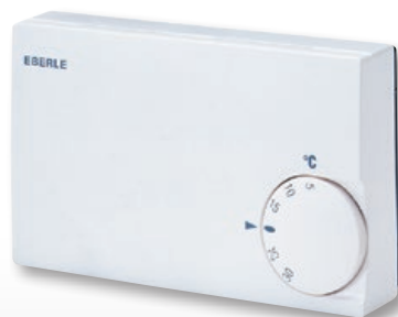
KLR-E 525 55

AC controller for residential and office applications with analog output