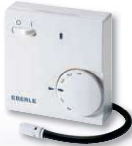
FR-E 525 31/i