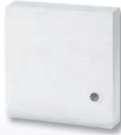
F 190 021