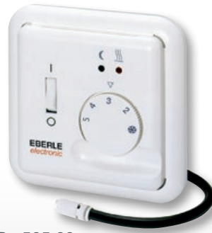
FRe 525 22

kein Lagergerät – nur auf Anfrage not carried on stock – only on request